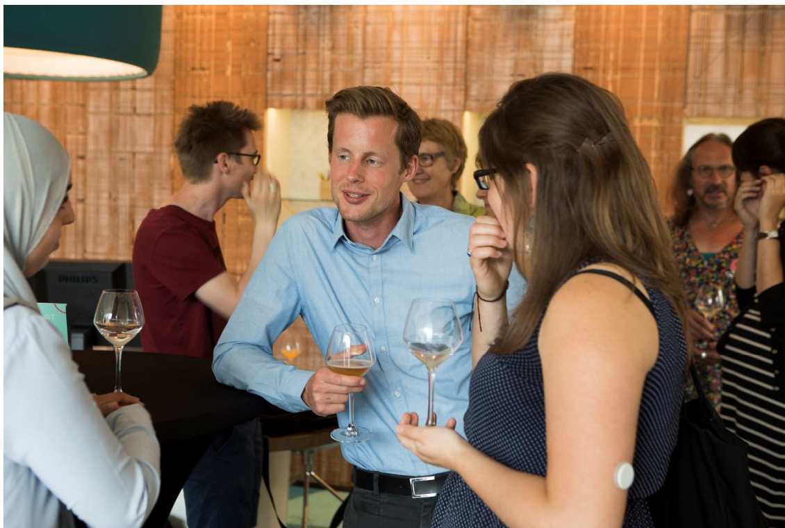
Lancering Muntuit bij Triodos Gent