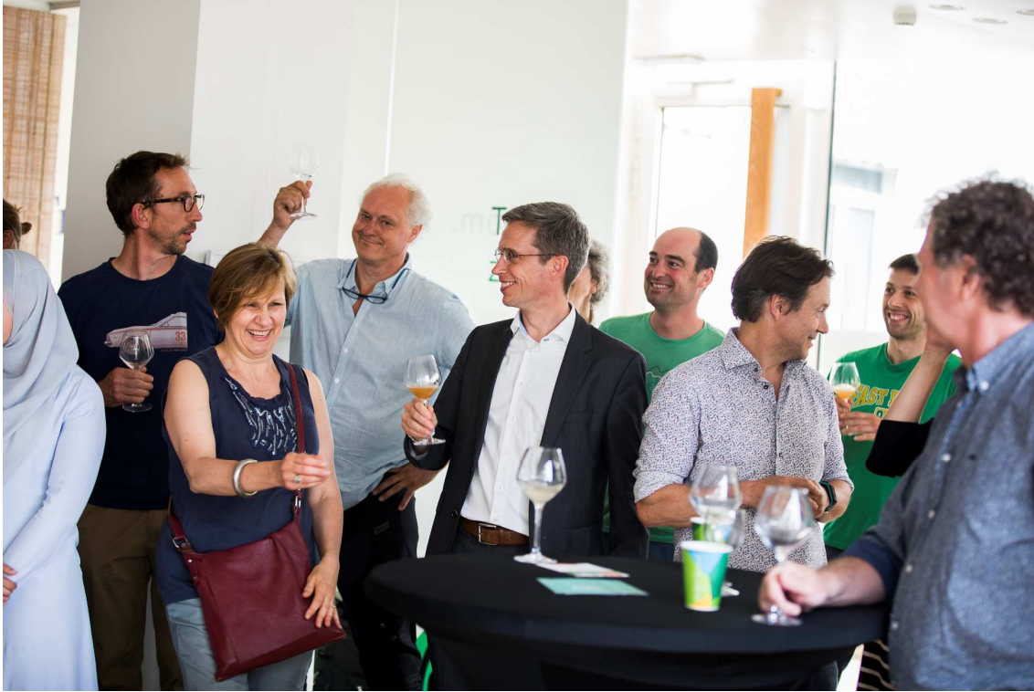
Lancering Muntuit bij Triodos Gent