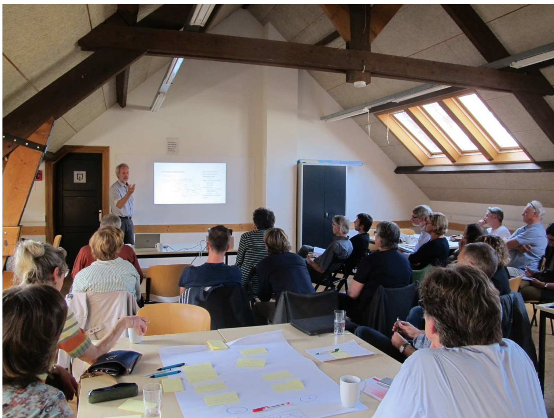
Ontmoetingsdag bij Buurtwerk Posthof vzw

We organiseerden als steunpunt 2 specifieke evenementen in 2017: