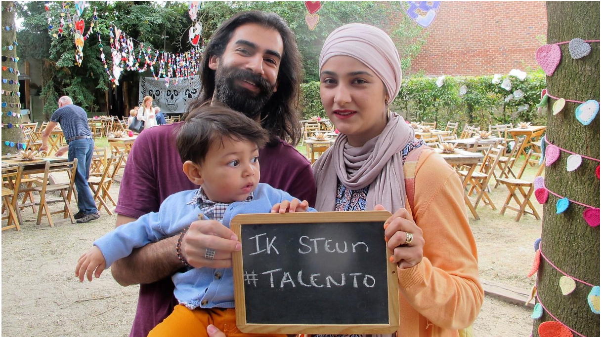
In Roeselare werkten we met de TalentO mee aan de empowerment en integratie van erkende vluchtelingen