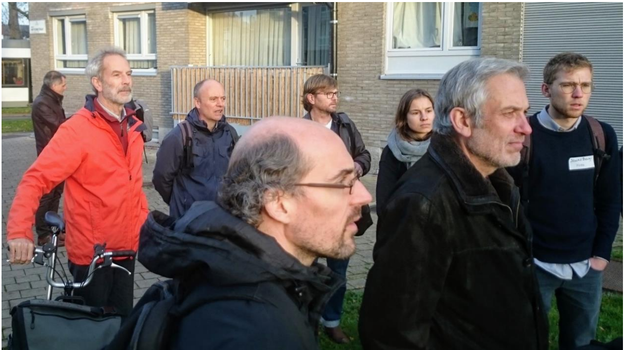
Ontmoetingsdag bij Torekes - Samenlevingsopbouw Gent

We organiseerden 2 specifieke netwerkevenementen in 2018: