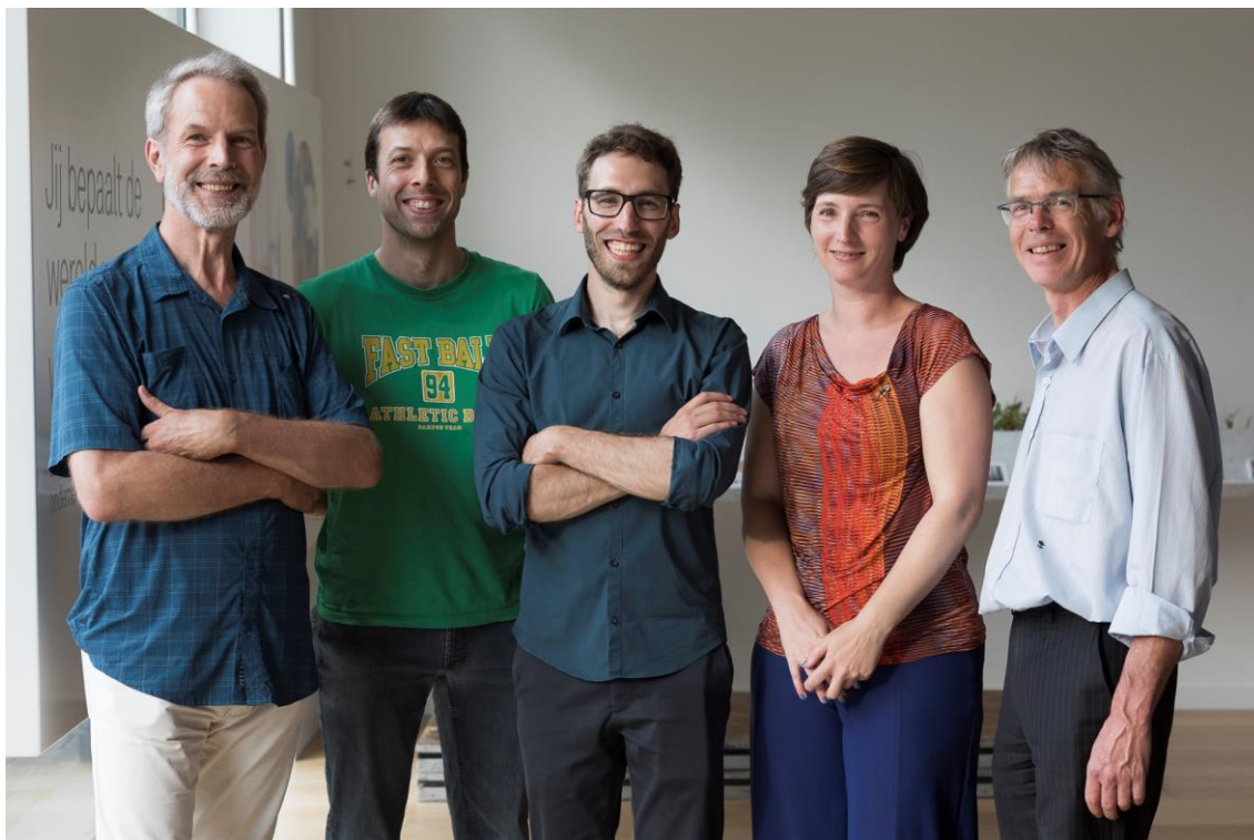
Raad van bestuur en team

De raad van bestuur bleef in 2018 onveranderd: