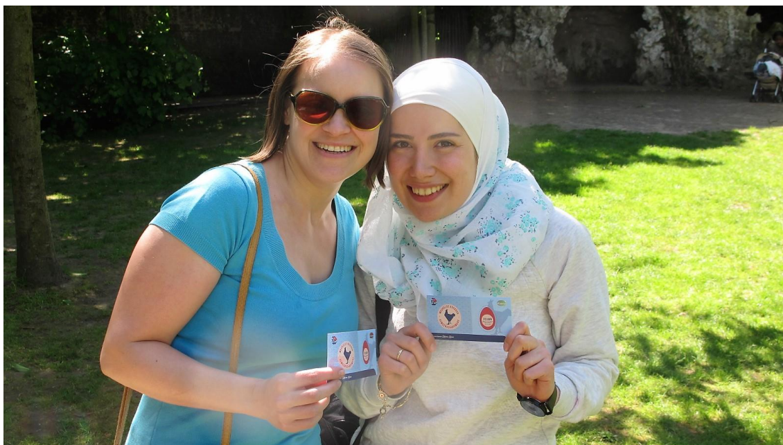
In 2018 werd de Mechelse Koekoek voor en door buurtorganisaties in de Heihoek gelanceerd

Tijdens ons tweede jaar konden we voortbouwen op de prospectie uit 2017 om volgende projecten mee te realiseren: