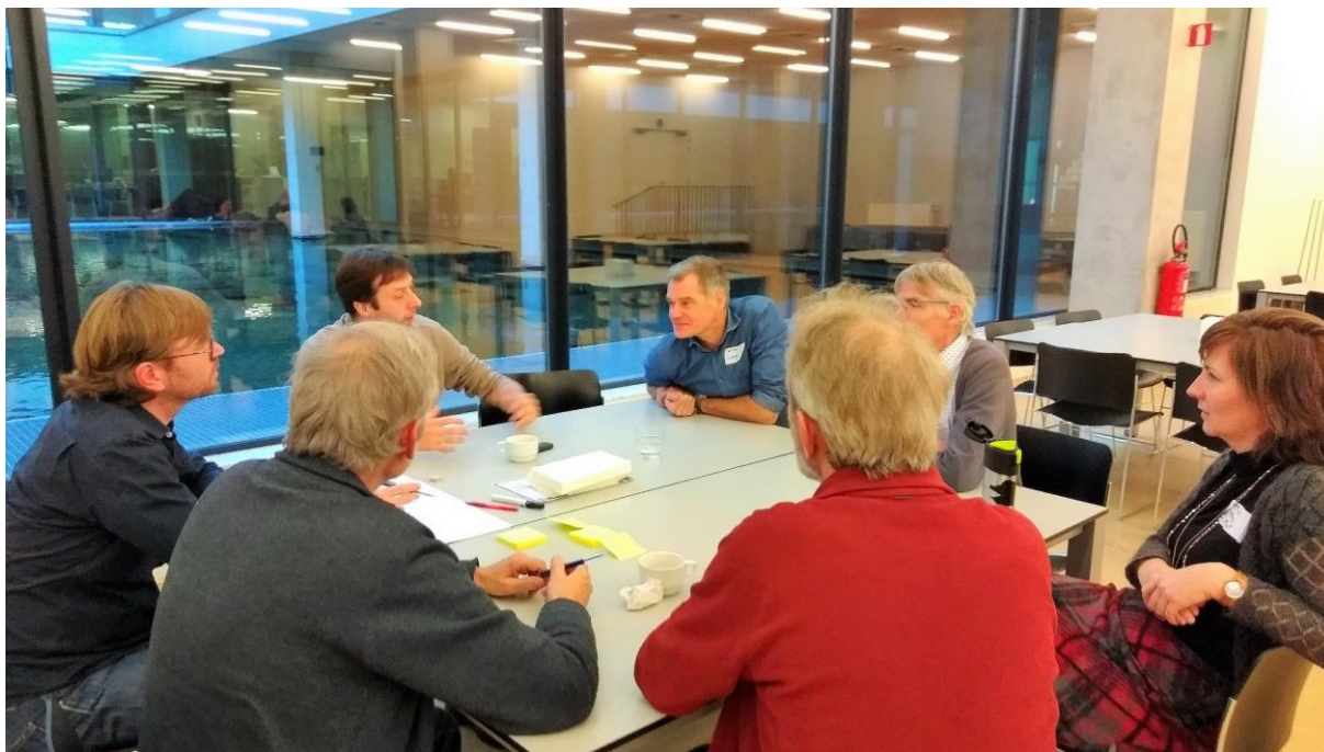
Sfeerbeeld ontmoetingsnamiddag