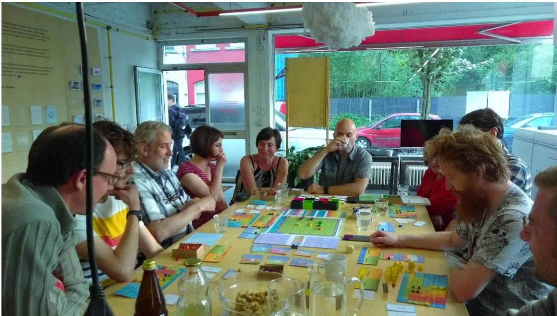
Spelsessie met Happonomy bij Timelab