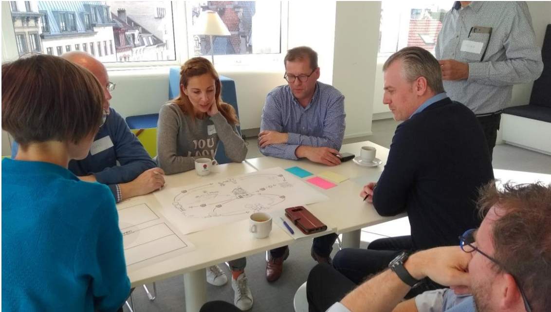
Lokale besturen ontdekken gemeenschapsmunten als beleidshefboom op de opleidingsdag

Daarnaast gingen we ook in 2019 met verschillende partijen gesprekken aan met het oog op nieuwe projecten. Dat resulteerde onder meer in volgende projecten: