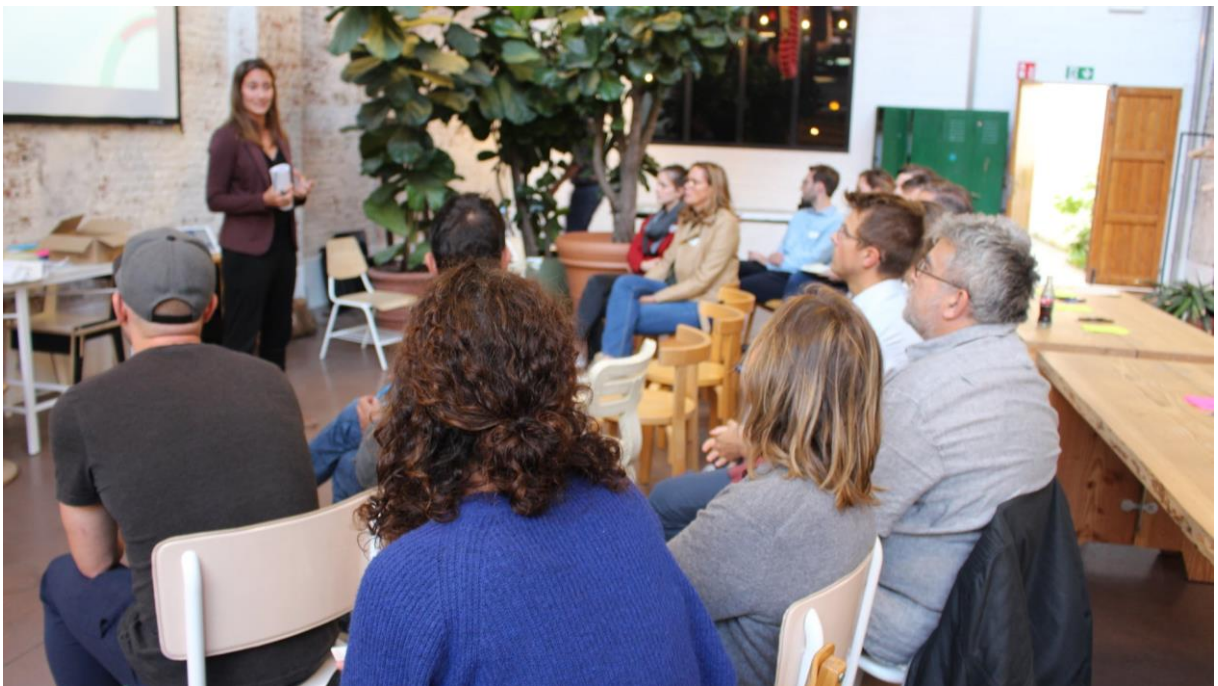
Inspiratiesessie tijdens het traject voor Oh-Coin