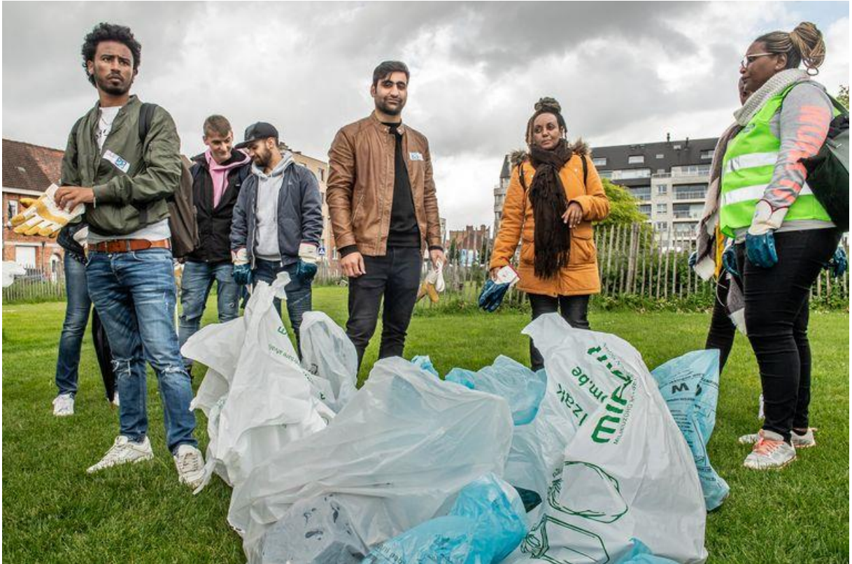
Deelnemers aan TalentO in actie

Ontwikkeling, begeleiding en advies van en voor gemeenschapsmunten over heel Vlaanderen. Het laatste jaar waren we actief in en bij onderstaande projecten . Telkens werkten we samen met verschillende lokale partners (burgerinitiatieven, middenveldorganisaties, lokale handel, lokale besturen, media,...):