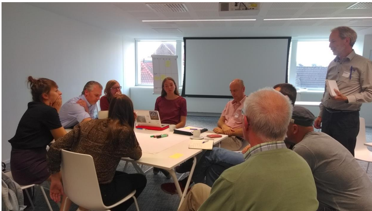
Brainstorm op ontmoetingsdag Muntuit bij VVSG