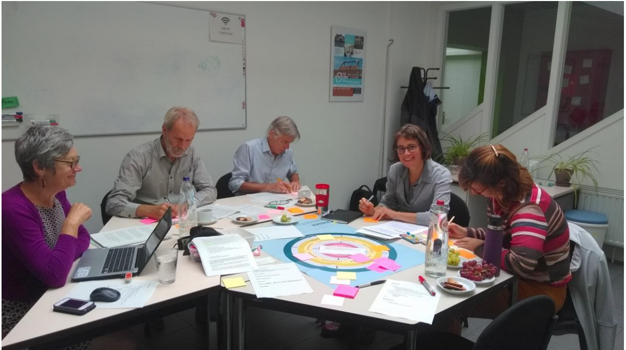
Sfeerbeeld beleidsplanningsproces

Op de algemene vergadering van maart 2019 werd formeel het startschot voor het beleidsplanningsproces gegeven. Een planning werd opgesteld en een beleidsplanningsteam, met enkele geïnteresseerde leden, samengesteld.