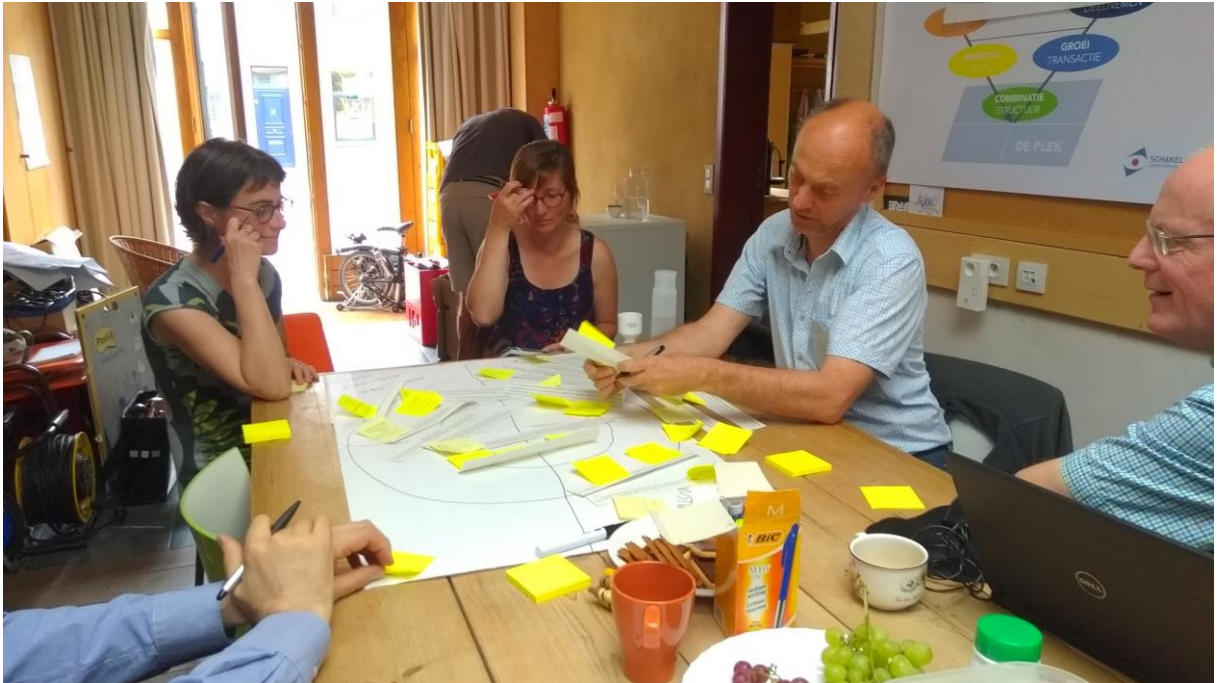
Sfeerbeeld beleidsplanningsproces