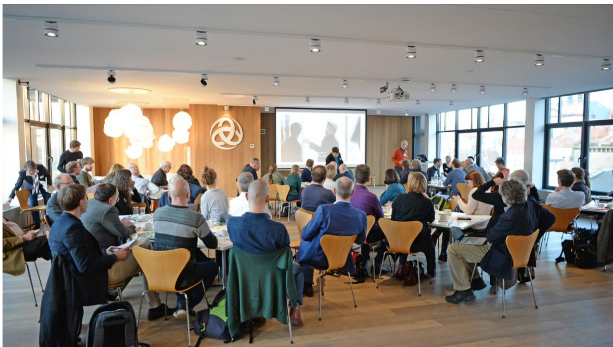
Seminarie ter ere van Bernard Lietaer bij Triodos Bank

We organiseerden 4 specifieke netwerkevenementen in 2019: