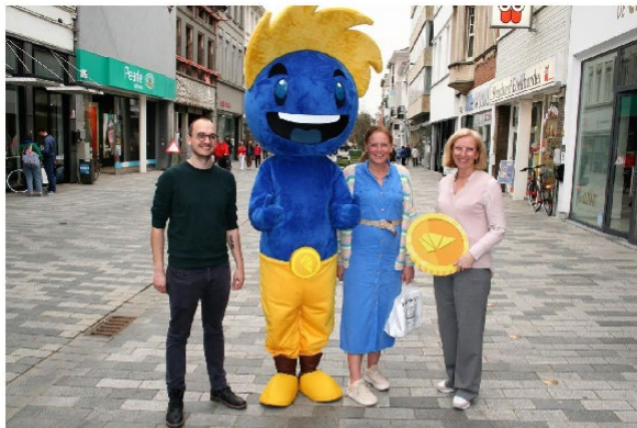
Mascotte Kiasa deelt zaterdag en zondag zijn eerste Sengzen uit. Maar ze zijn ook te verdienen: bij al 125 Sint-Niklaase handelaars.