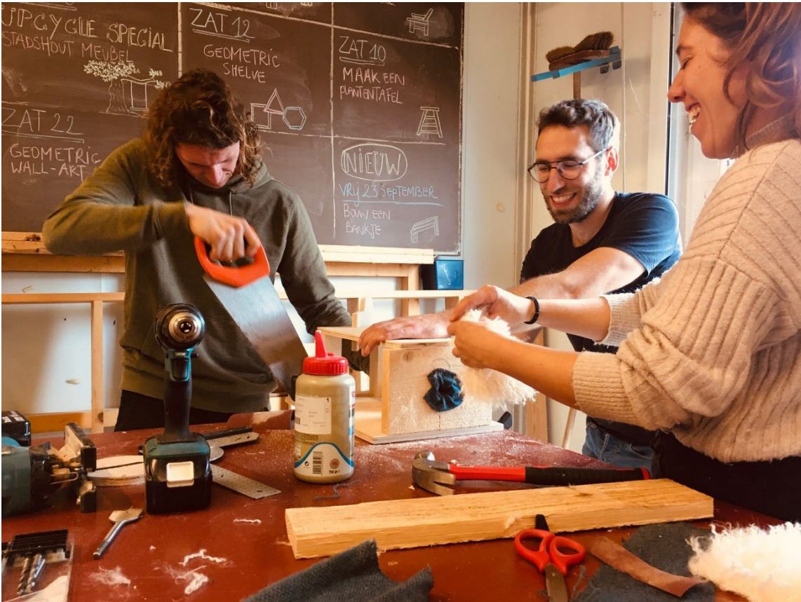
Teambuilding in het teken van circulaire economie