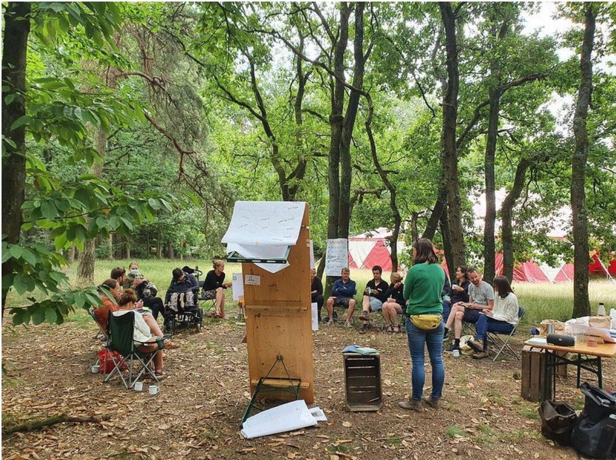
Enrich op Wereldkamp Broederlijk Delen