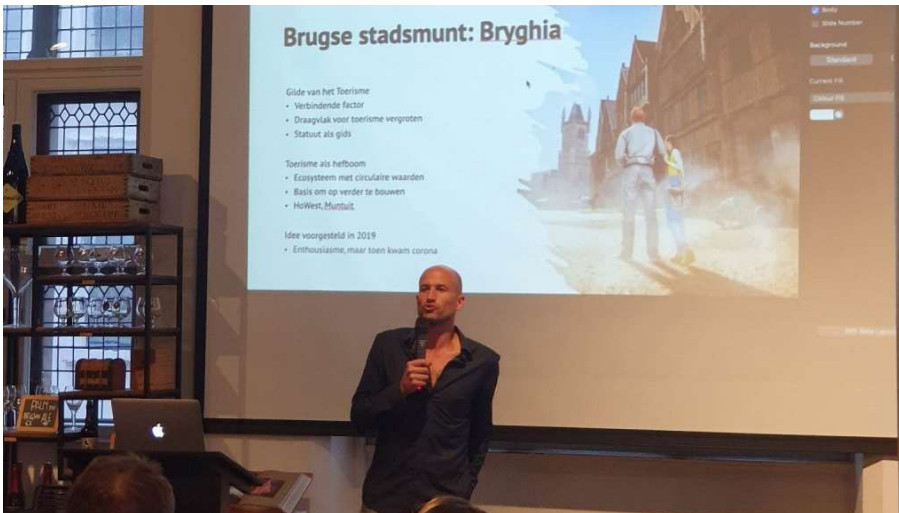
Presentatie Brugse stadsmunt Bryghia door Beyond Bruges

OD4.2 We voeden en inspireren het lerend netwerk door goede praktijken en kennis hapklaar te delen