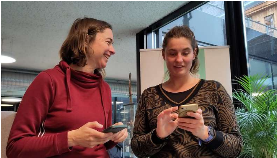
De webapp wordt getest in en rond ons kantoor in Gentbrugge

OD2.2 Ten laatste in 2022 plukken onze leden en andere waardevolle praktijken de vruchten van de technologische versnelling, in de eerste plaats op het vlak van digitaal betaalverkeer via de toegang tot een super inclusief, geschikt en betaalbaar betaalplatform