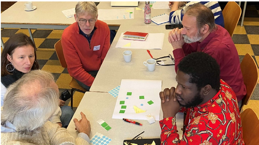
Community Brouwers 2023 in de Nieuwe Vrede in Berchem

OD4.1 We faciliteren de samenwerking en structurele uitwisseling met en tussen praktijkmunters, partners en potentiële nieuwe gangmakers via actieve matchmaking en de organisatie van ontmoetingsmomenten