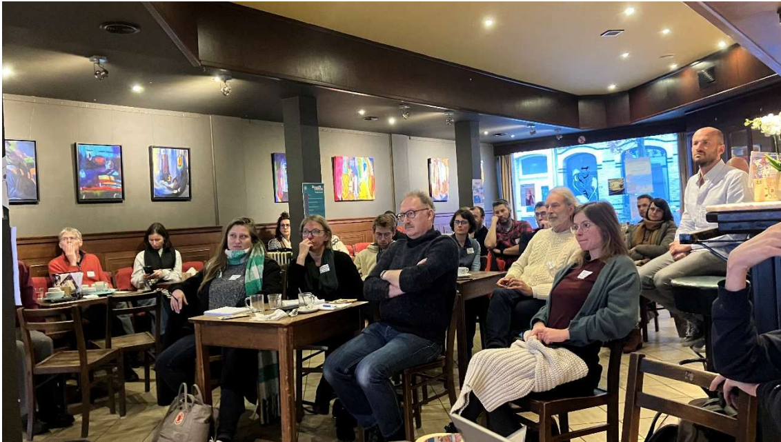
Sfeerbeeld Community Brouwers 2023