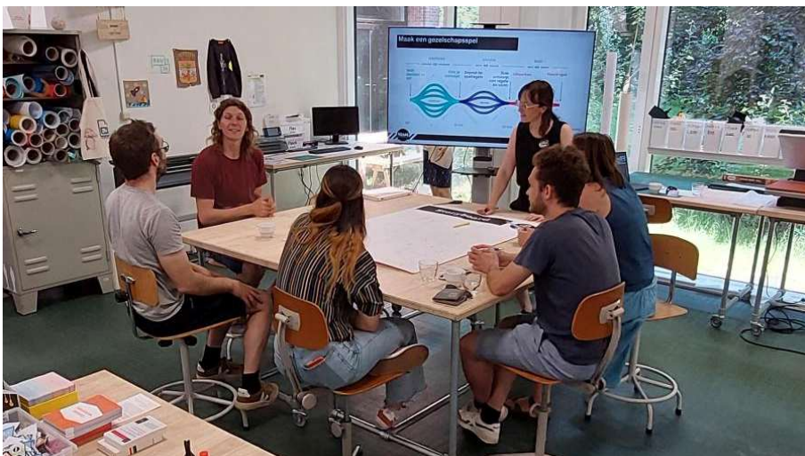
Teambuilding in Brugge