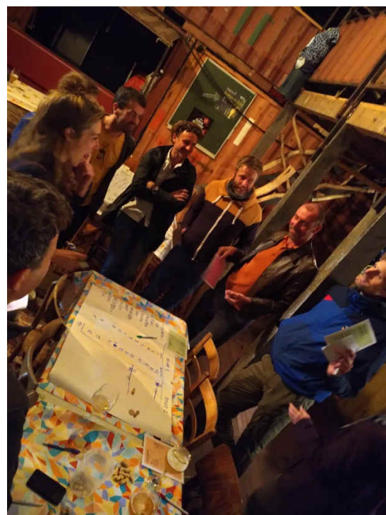
Spelsessie Enrich in Diest