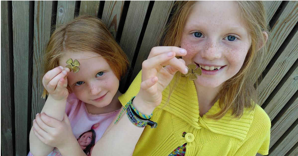
Sfeerbeeld Klavers Loreco-project